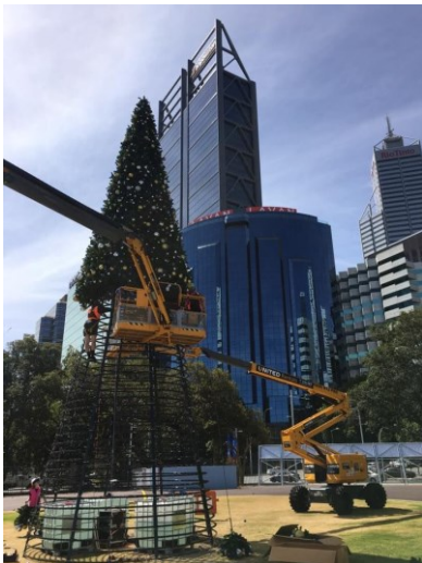
15mツリーの組立作業風景

このため設置工事の際は、人が登って作業を行うことが可能となり、組み立て時間の短縮が可能です。6m以下の場合、高所作業車が無くても設置作業ができます。