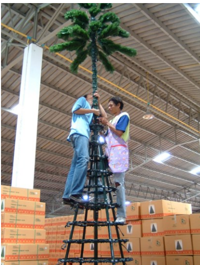
人が枠組みに登って組立可能

屋外で使用する場合、強風による転倒防止処置を行ってください。ツリー周囲に設置したアンカーにワイヤーで支線を張って固定してください。