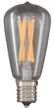
ミニアンティーク E17