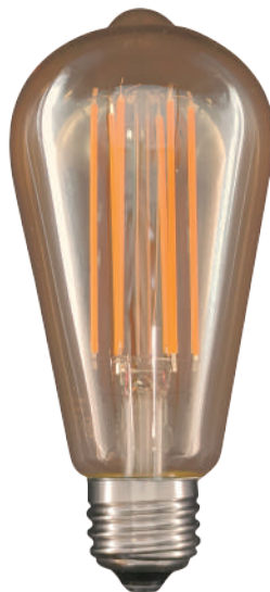
アンティーク 琥珀