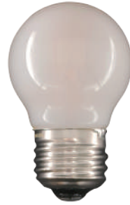
G45 ミニボール E26 乳白