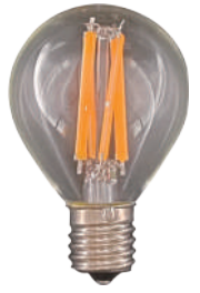
G45 ミニボール E17 クリア