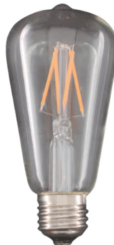
アンティーク クリア