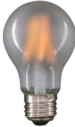
一般電球 フロスト