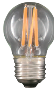
G45 ミニボール E26 クリア